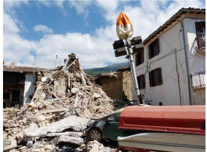
19 – San Lorenzo a Flaviano (Amatrice)