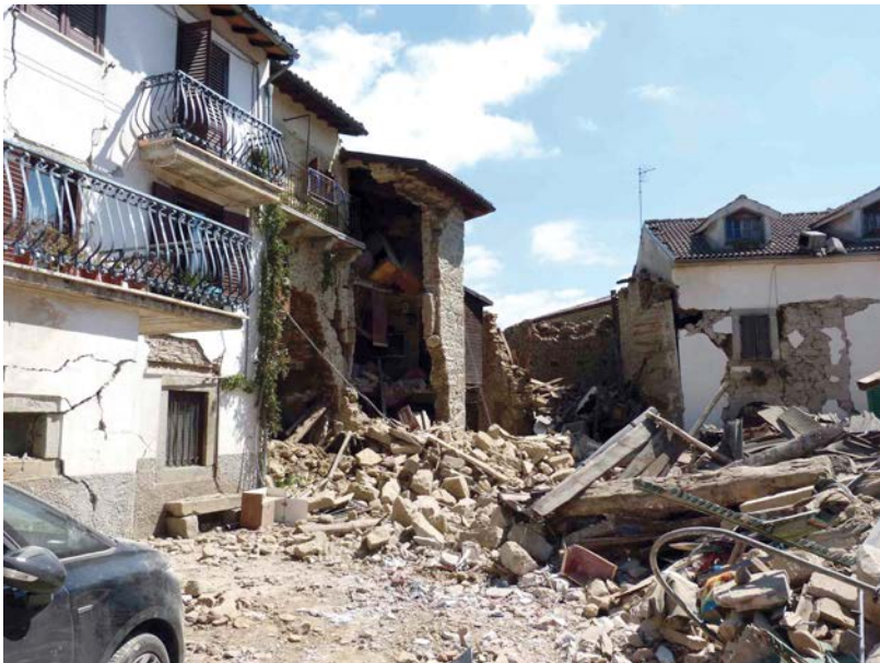
20 – San Lorenzo a Flaviano (Amatrice)