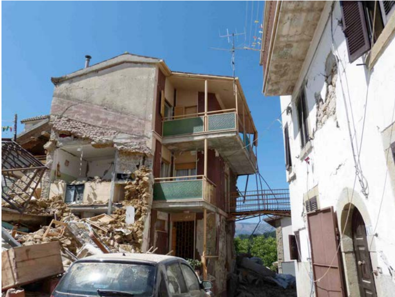
17 – San Lorenzo a Flaviano (Amatrice)