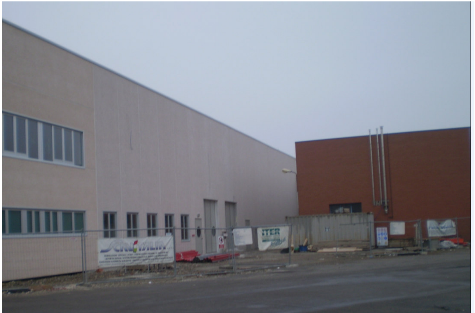
FARMAC ZABBAN SPA