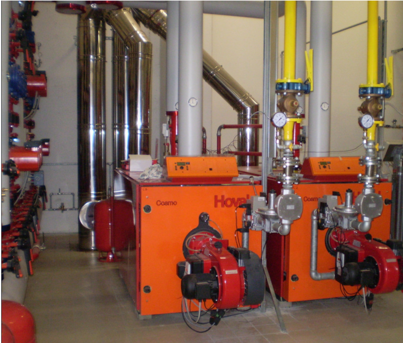
FARMAC ZABBAN SPA