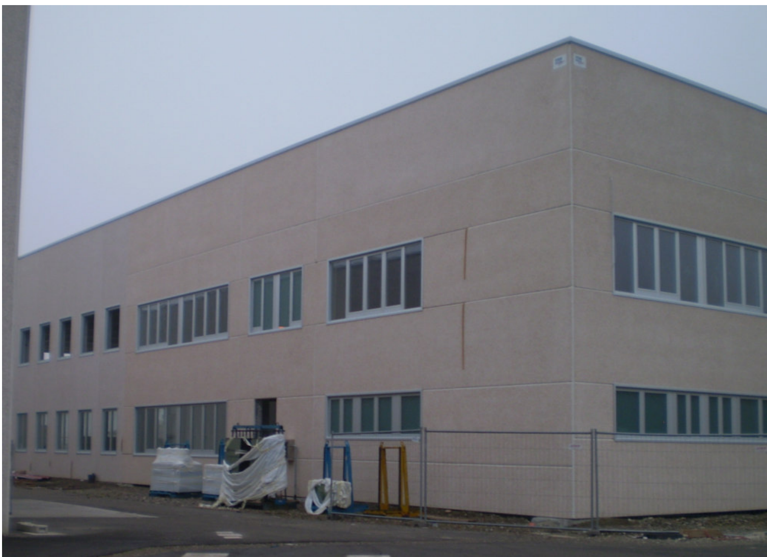
FARMAC ZABBAN SPA