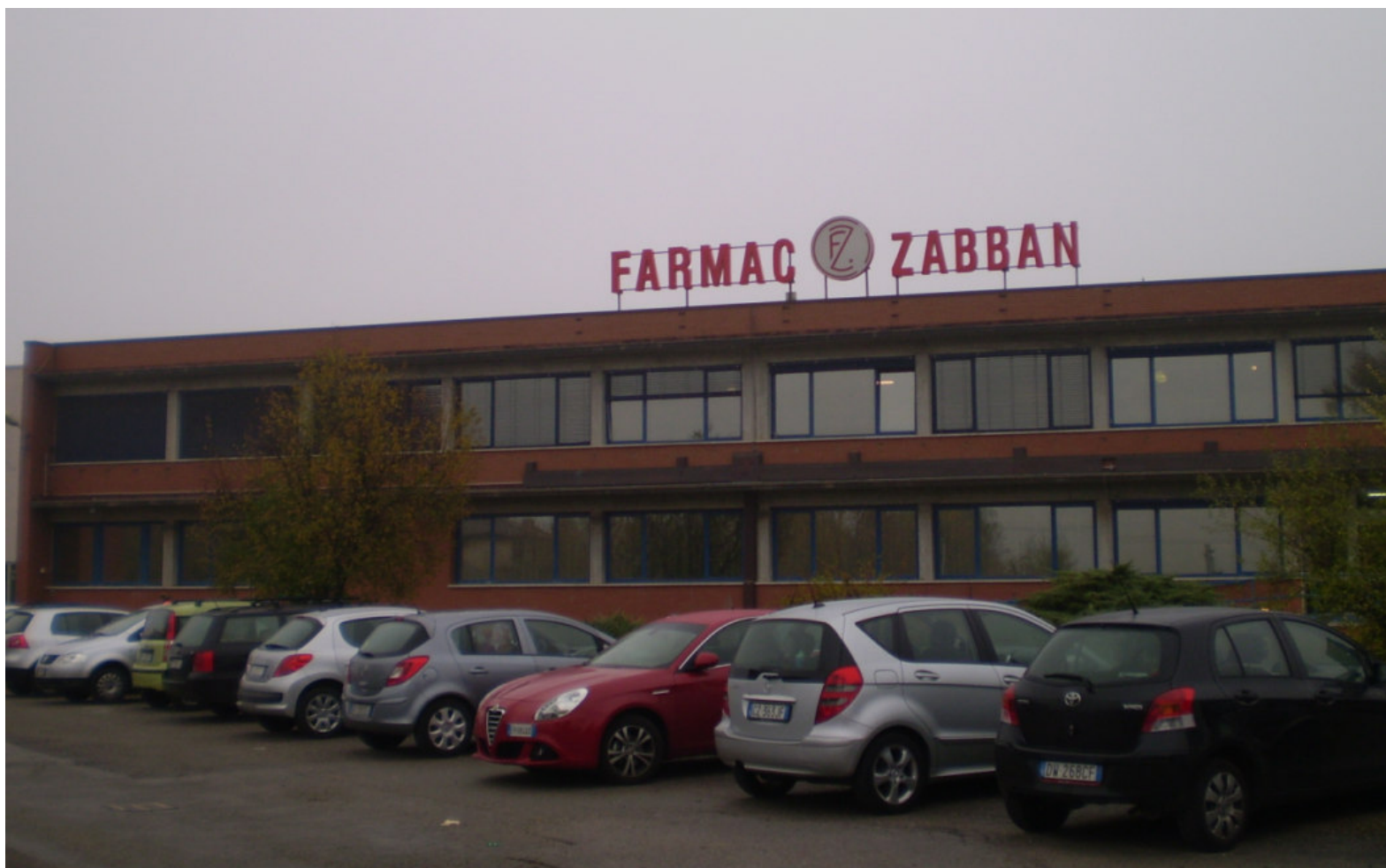
FARMAC ZABBAN SPA