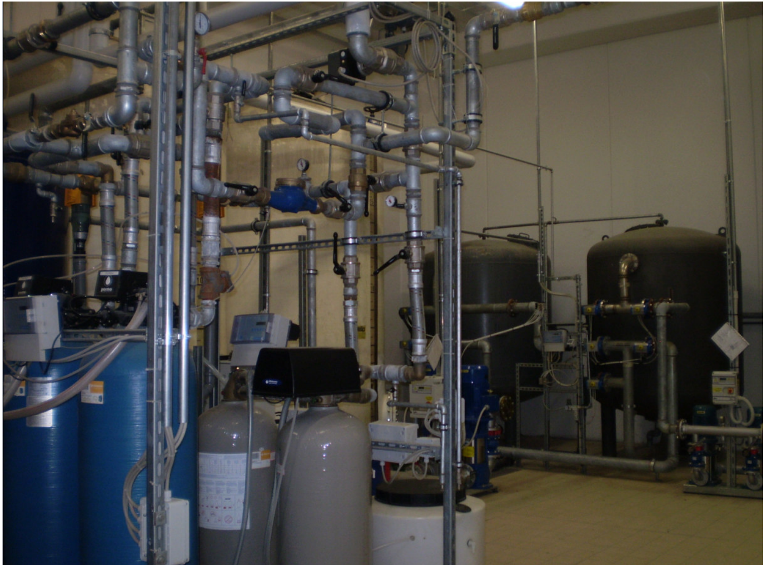
FARMAC ZABBAN SPA