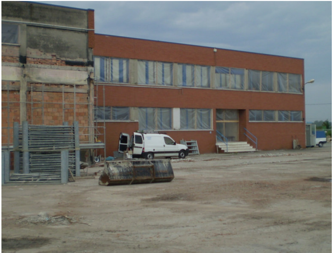
FARMAC ZABBAN SPA