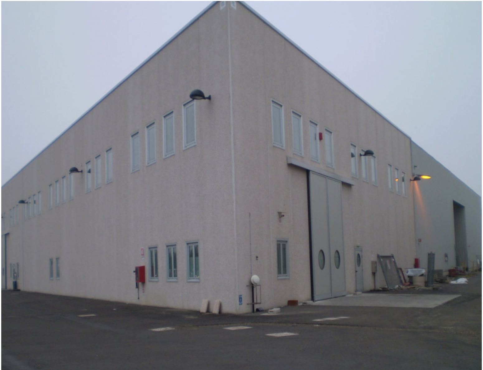
FARMAC ZABBAN SPA