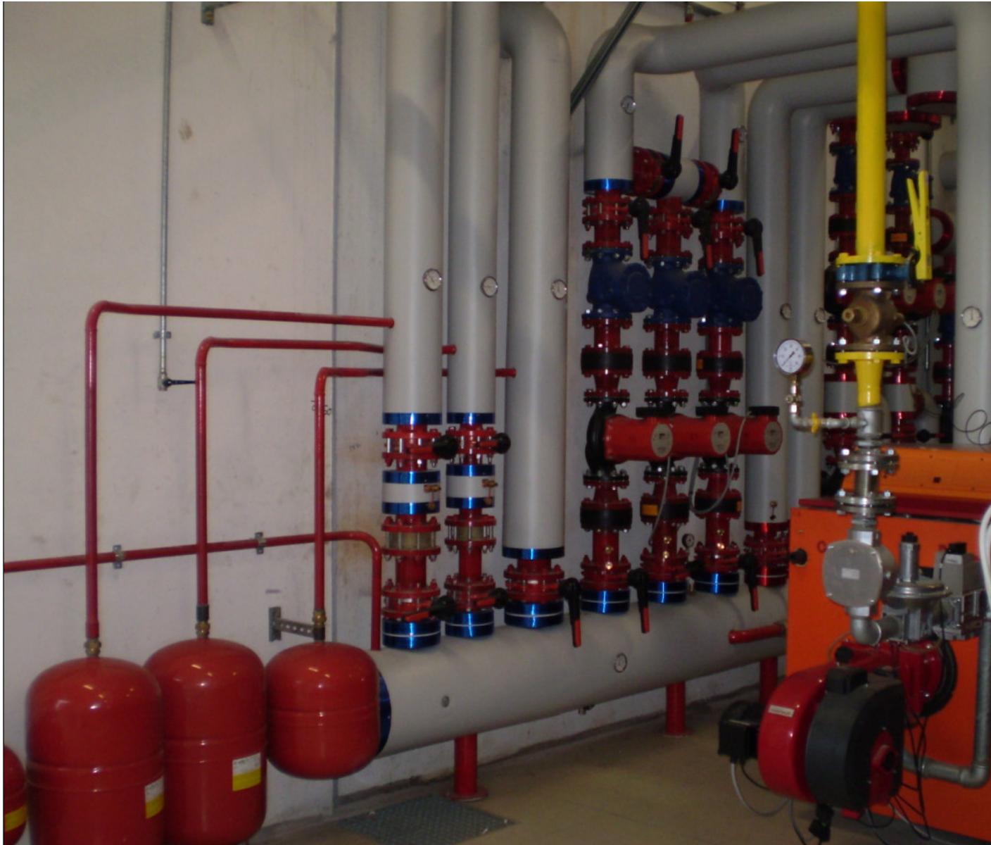
FARMAC ZABBAN SPA