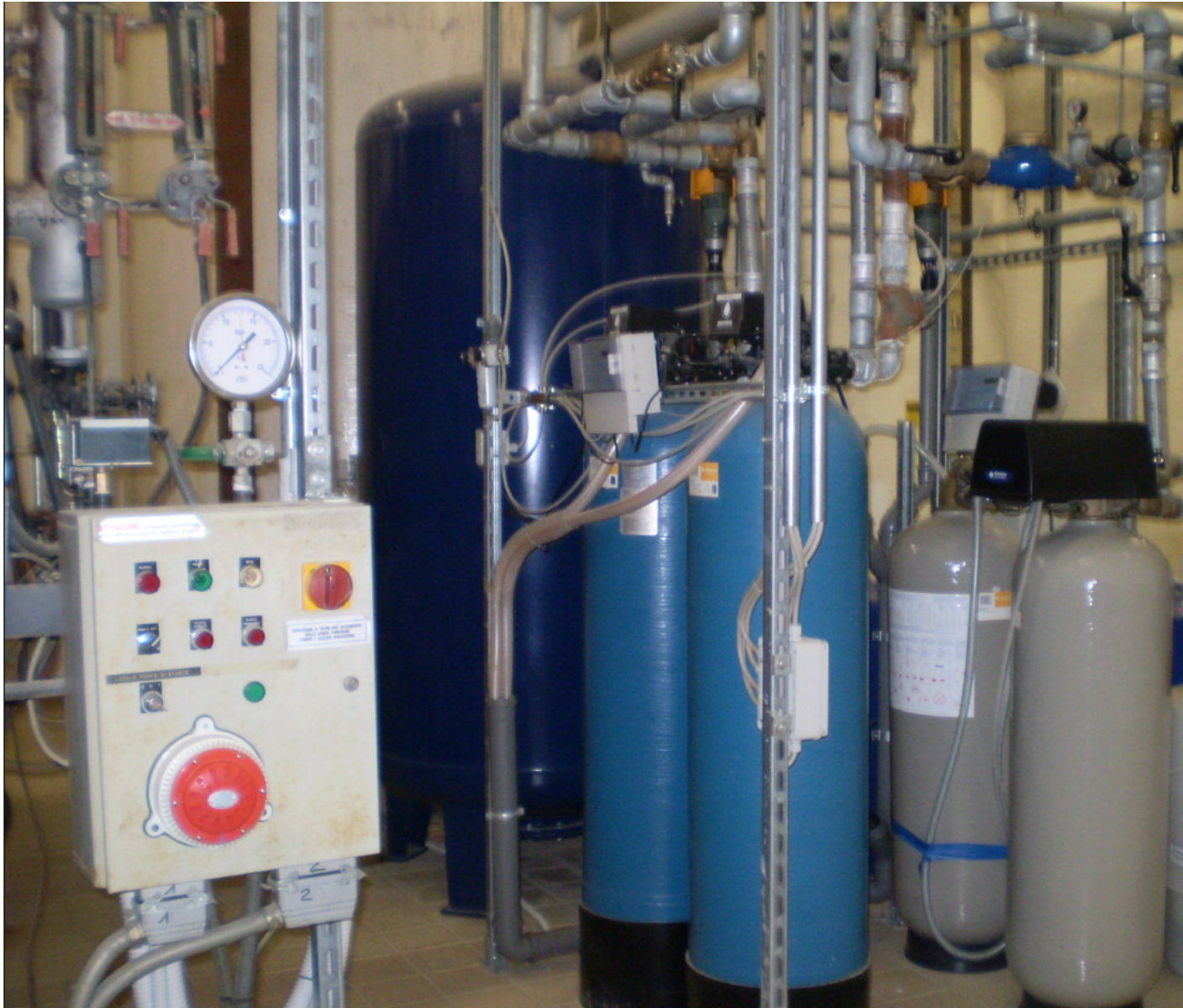
FARMAC ZABBAN SPA