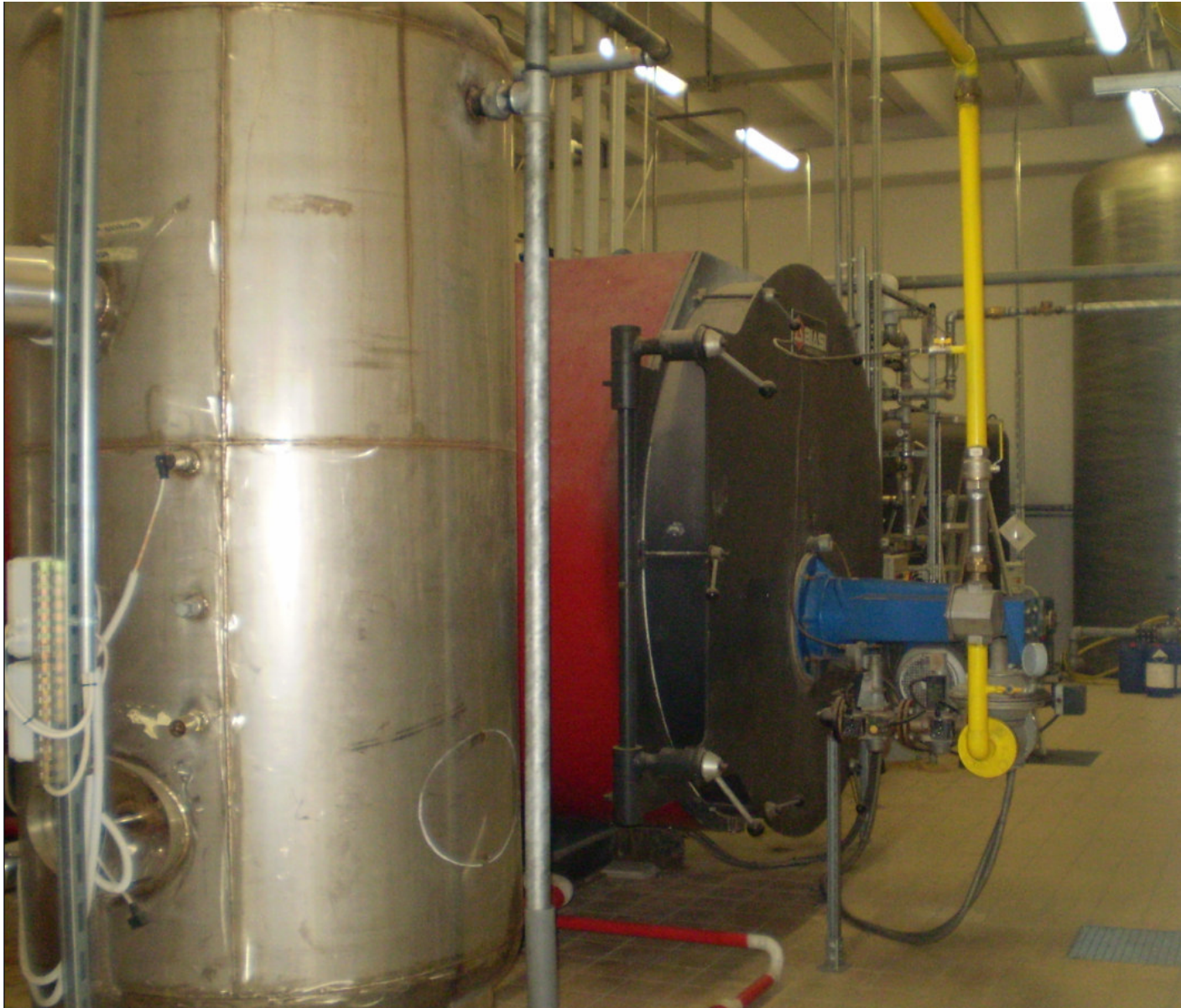
FARMAC ZABBAN SPA