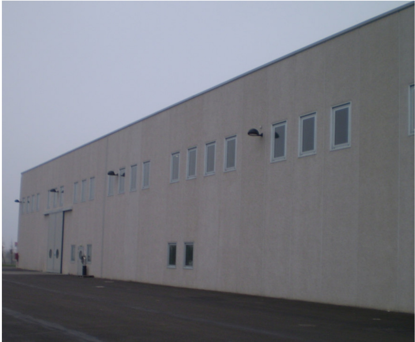
FARMAC ZABBAN SPA